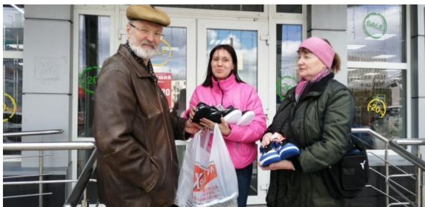
Накануне майских праздников люди, прибывшие из Лисичанска в зимней обуви, приобрели лёгкие кроссовки для себя и своих детей