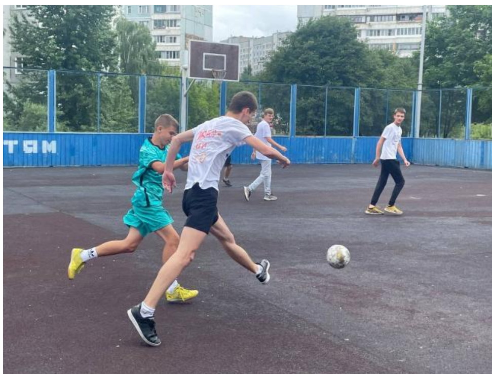
Матч в разгаре