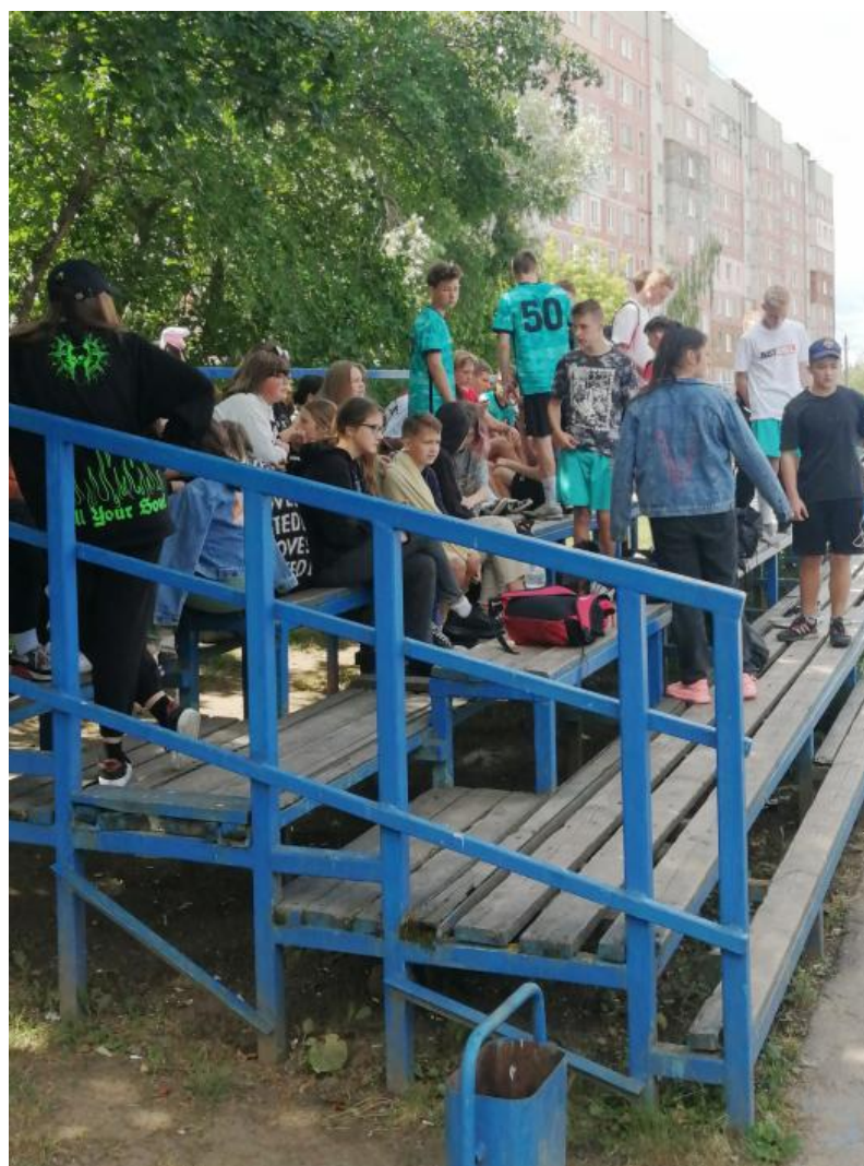
Болельщики на трибунах