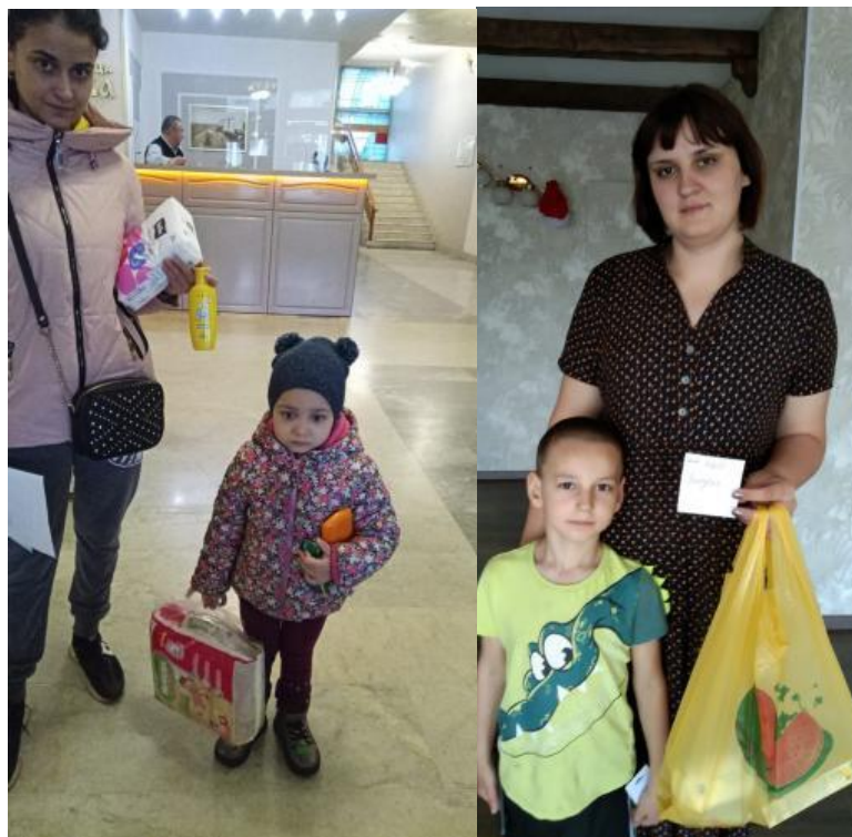
Для семей с малышами – элементарные сангигиенические средства и памперсы