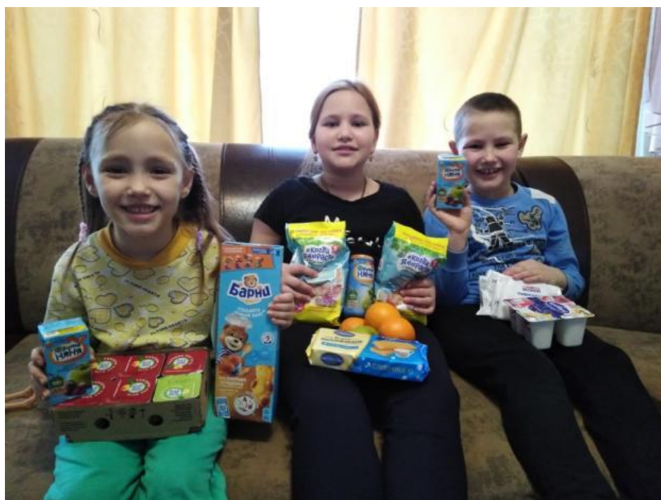
А это просто гостинцы для тех детишек, кто только-только спасся с линии фронта