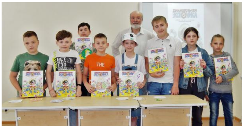
Совместное фото с автором