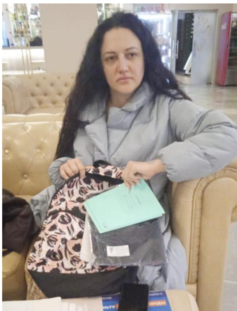
Мама, у которых дети пойдут в школу, к первому сентября получили ранцы и наборы ученических принадлежностей