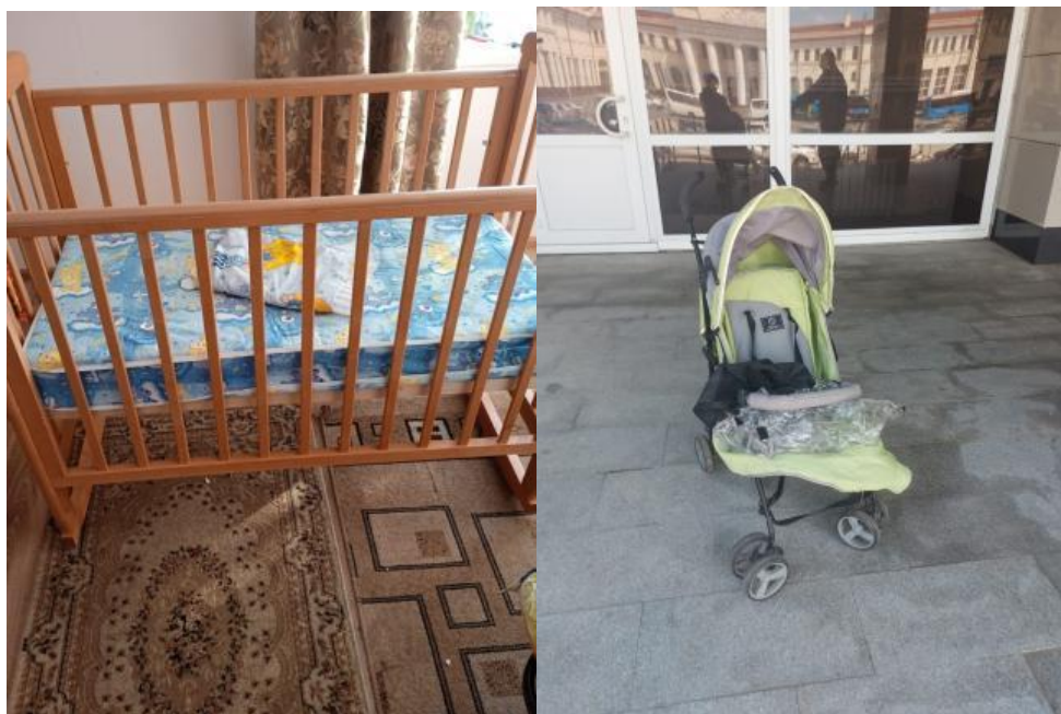
Для нуждающихся – детская кроватка и коляска